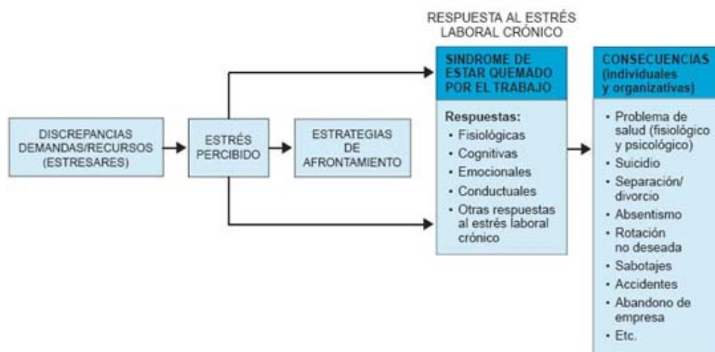
Figura 1 Proceso y consecuencias del SQT "Gil - Monte 2005"